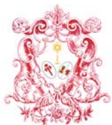
Cofradía de la Sagrada Cena y Ntra. Sra. del Sagrario Cáceres