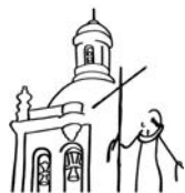
Diócesis de Coria-Cáceres